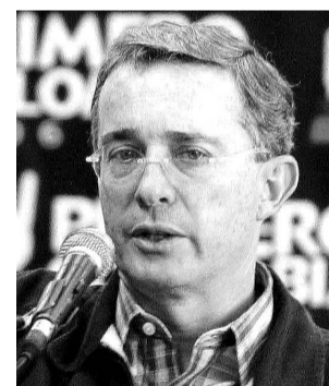
Álvaro Uribe Vélez, movimiento Primero Colombia.