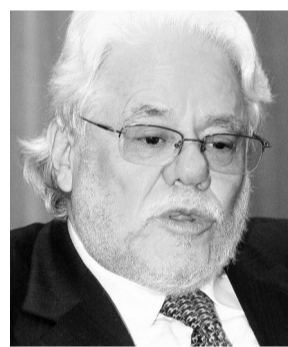
Carlos Gaviria Díaz.

- Consolidaremos la judicialización de los corruptos exigiendo que estos repongan los recursos apropiados de manera indebida.