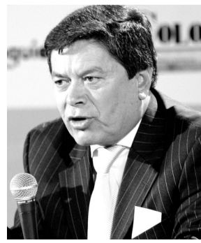
Carlos Rincón Barreto.

- Su gobierno designará secretarios, que dependan de las Gobernaciones para que se hagan presentes en los Concejos Municipales y de esta manera fiscalicen las normas y las contrataciones de manera previa.