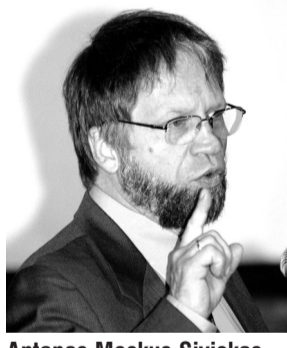
Antanas Mockus Sivickas.

"Qué quiere decir dinero sagrado: que la ley no puede declarar que algo es sagrado, la cultura sí. Refuerza las prohibiciones, puede decir: si se toca un peso público se le va a devolver en maldiciones. El que evade impuestos también roba al Estado y en este sentido tendríamos que hacer nuestra propia inserción, confesarnos", declara.